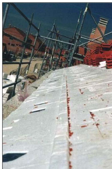
Rastreles perfectamente alineados